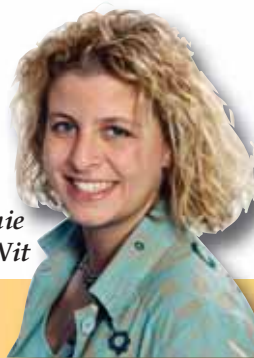
Sophie De Wit

Liesbeth Homans , geboren en wonende in het Antwerpse district Wilrijk, werd in 2006 rechtstreeks verkozen in de provincieraad van Antwerpen, waar ze vooral werkte rond thema's als ruimtelijke ordening en huisvesting. Liesbeth is licentiate geschiedenis. Als sportieve vrouw ging ze na haar studies werken als coördinator van een sportfederatie. Sinds 2004 was ze parlementair medewerkster van Bart De Wever.